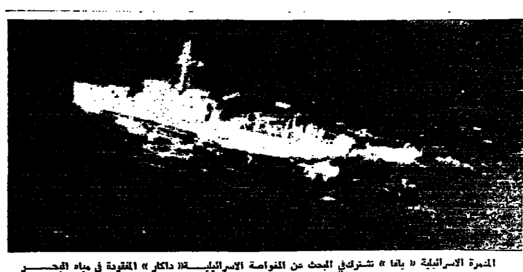
التمرة الإسرائيلية « يا » تتحرك في المعركة من الفصاحة الإسرائيلية « دالكر » المقودة في مياه البحر الأبيض المتوسط المهال على بعد ٢٥ ميلا من الساحل الفلسطيني - »